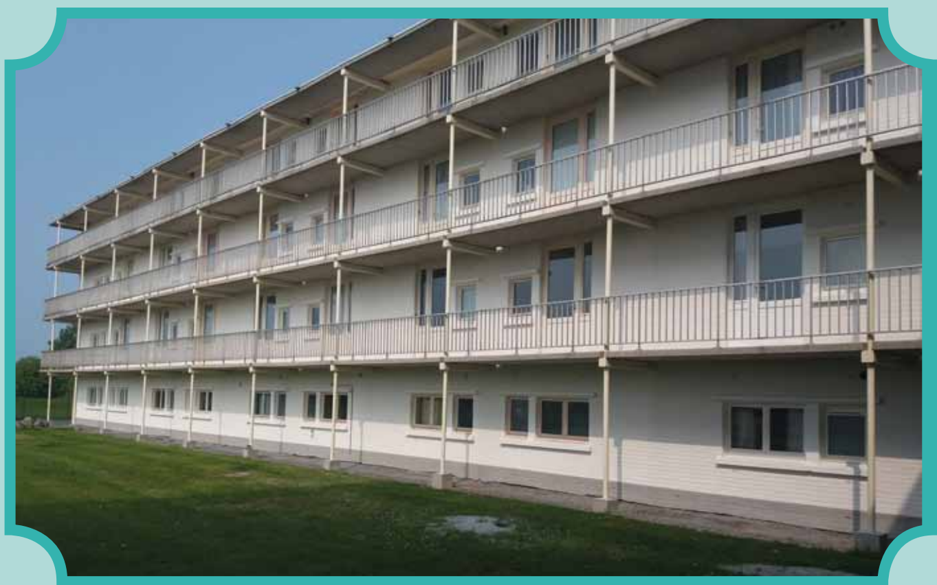
De nieuwe Hyacint / Le Nouveau Hyacint (Pag.7-9)