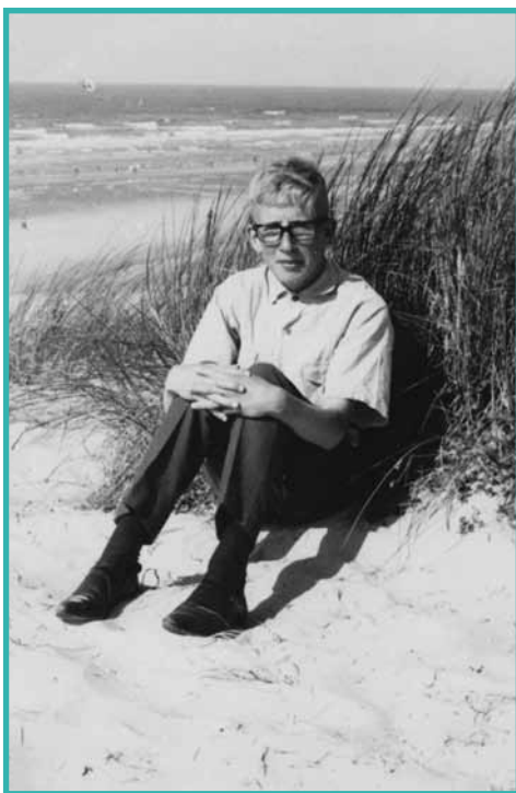
Een foto van mij, tijdens een bezoekdag / Une photo de moi lors d'un jour de visites