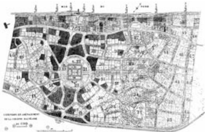
Plan Stübben, 1910