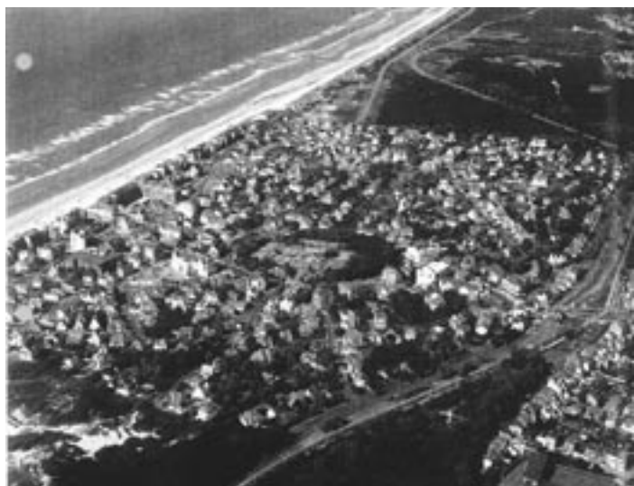
De Concessie en de moderne verkeerswegen