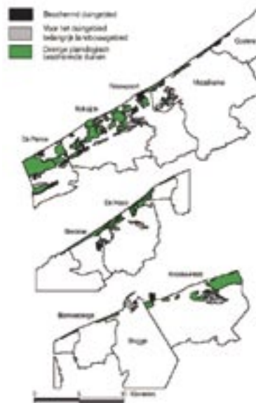
Overzicht van de duinenbescherming aan de Belgische Kust. [website Instituut voor natuur- en bosonderzoek]

Het Duinendecreet van 15 september 1993 (Belgisch Staatsblad, 17 september 1993) bepaalde dat de bescherming van de ecologisch waardevolle duingebieden en het bouwverbod centraal staan in het beheer. Bij decreet van 16 november 1994 (Belgisch Staatsblad, 30 november 1994) werd overgegaan tot de definitieve aanwijzing van de beschermde duingebieden. Op basis van het advies van het Instituut voor Natuurbehoud werden de volgende evaluatienormen gehanteerd: de oppervlakte van het gebied bedraagt minimaal twee hectare; het gebied wordt opgenomen in het ontwerp van de Groene Hoofdstructuur; het gebied moet gelegen zijn binnen een zeldzame geomorfologisch-pedologische formatie of langs de binnenduinrand; de actuele biologische waarde van het gebied is belangrijk. Het sluitstuk van dit Duinendecreet kwam op 4 oktober 1995 (Belgisch Staatsblad, 25 oktober 1995) tot stand. Het bepaalde definitief welke duingebieden beschermd zijn. Op bijgaande kaart wordt duidelijk dat de veranderende regelgeving ervoor heeft gezorgd dat de aanvankelijk beschermde Massartlocatie in Klemskerke vooralsnog vrijkwam waardoor de eigenaar snel grond kon valoriseren, met het huidige resultaat als gevolg.