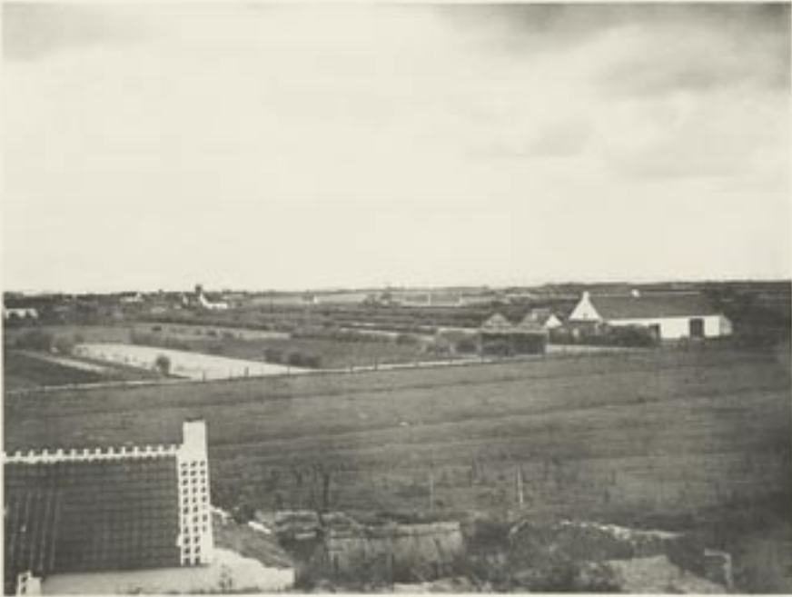
Cultures dans les polders sablonneux, à Oostkerke.

La base est garnie de blocs d'argile durcie. Les champs sont garnis et entourés de talus en terre, de terre qui vient des Bancs sous-jacents.