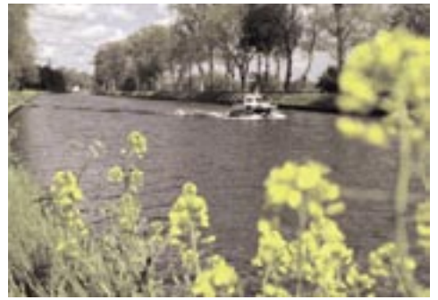
Links: Detail uit de plaat van Massart waarbij de bomenrij aan de horizon opvalt. Rechts: De bomenrij markeert de loop van de Yperleet (huidige kanaal Oostende-Brugge).