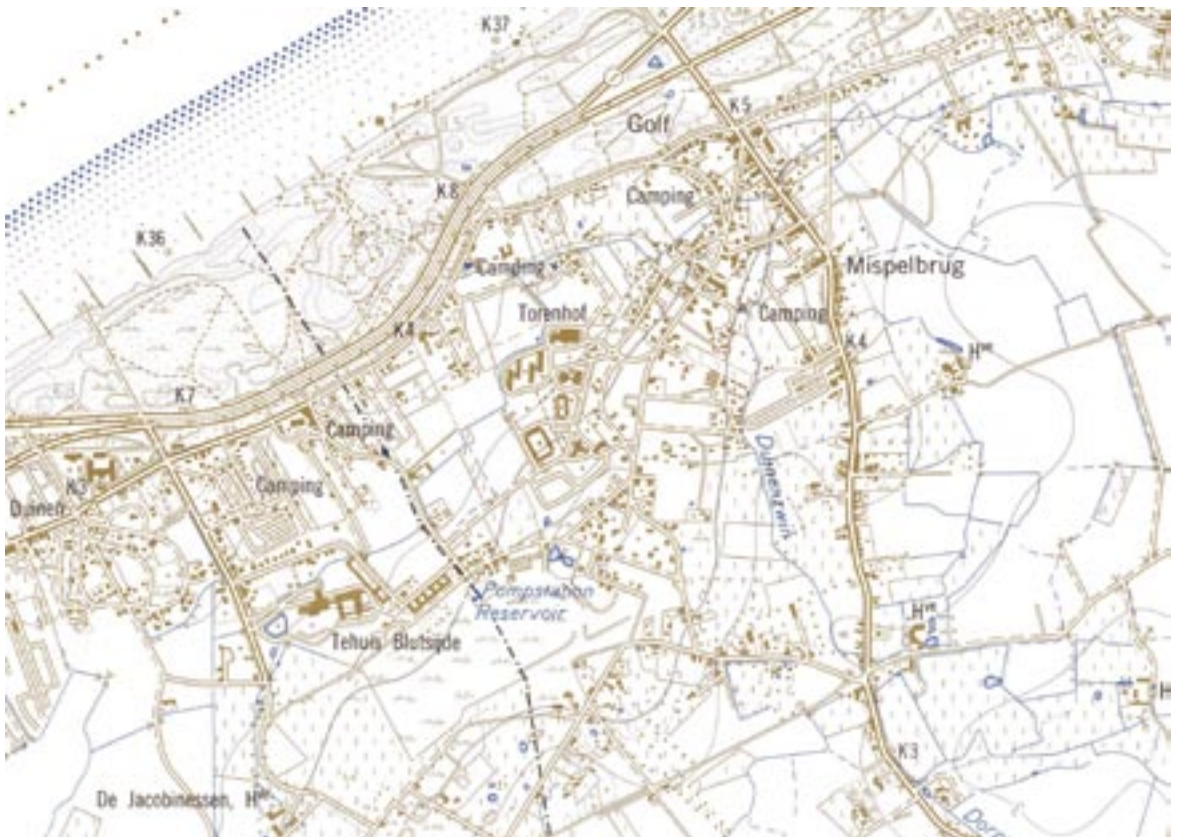
Topografische overzichtskaart (1969) [NGI]