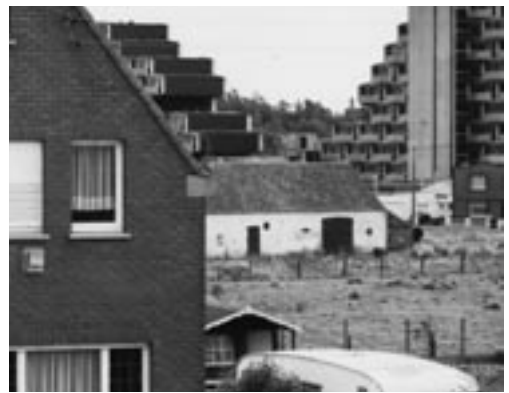
Detail uit de foto van Charlier. [Charlier 6]

Met de ontwikkeling van het kusttoerisme verschenen ook verhuur- en verkoopkantoren die villa's, huizen, appartementen