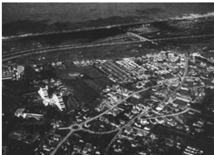
Wijk de Heide, met de piramideappartementen van Park Atlantis