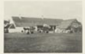
Les polders sablonneux, à Oostkerke. — Plus les polders sablonneux de Westende et de Westkerke, en culture intensive de légumes, pour le marché d'Anvers.

Plus des polders, terres de fertilité. De terre, les arbres qui bordent le Grand Canal d'Anvers.