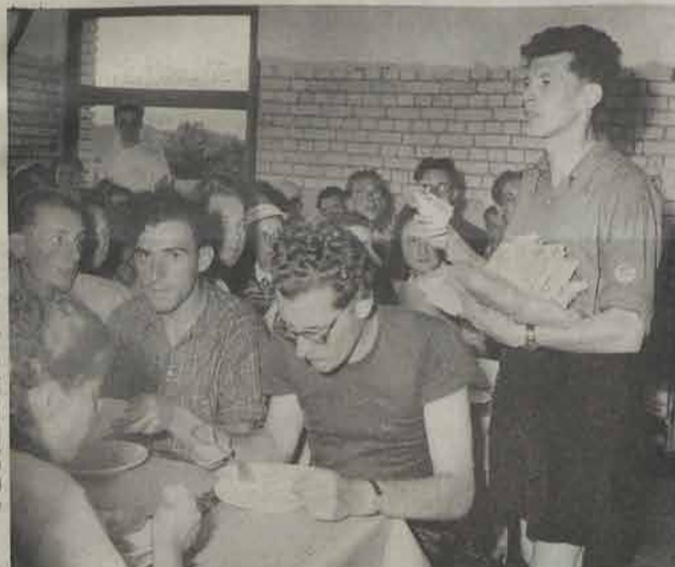
In het begin werd in de eetzaal de post afgeroepen. Toen waren er slechts een honderdtal verlofgangers. Momenteel zou dit hopeloos zijn. Speciale brievenbussen staan in beide recepties opgesteld en rangschikken de post in een alfabetische orde.