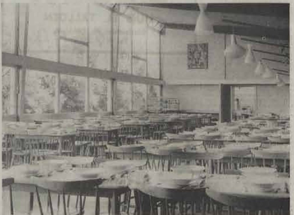
De nieuwe eetzaal.