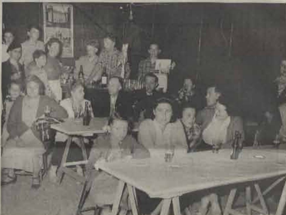
Vroeger geen lukse of comfort.

Hoeveel aangename uren werden hier niet doorgebracht!