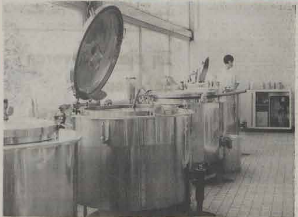
De ultra-moderne keuken, een streling voor het oog.