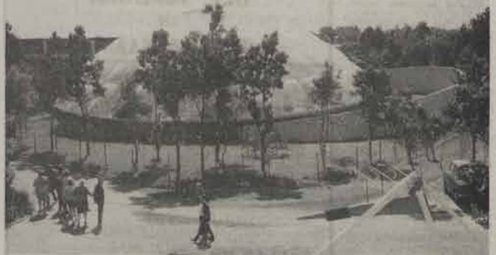
De gloednieuwe overkoepelde zwemkom. De attractie van het jaar 1967.