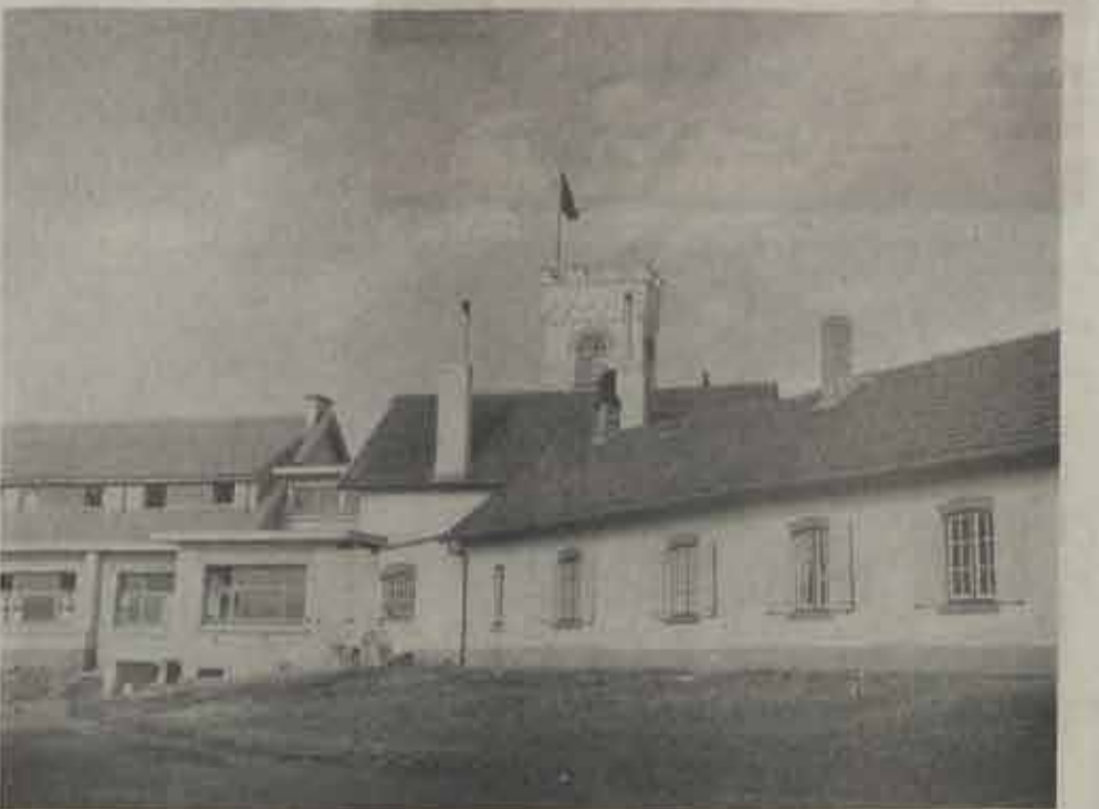
De eerste verbouwwerke waren van dien aard