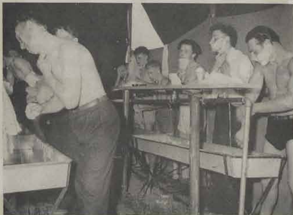
De eerste gemeenschappelijke waszaal