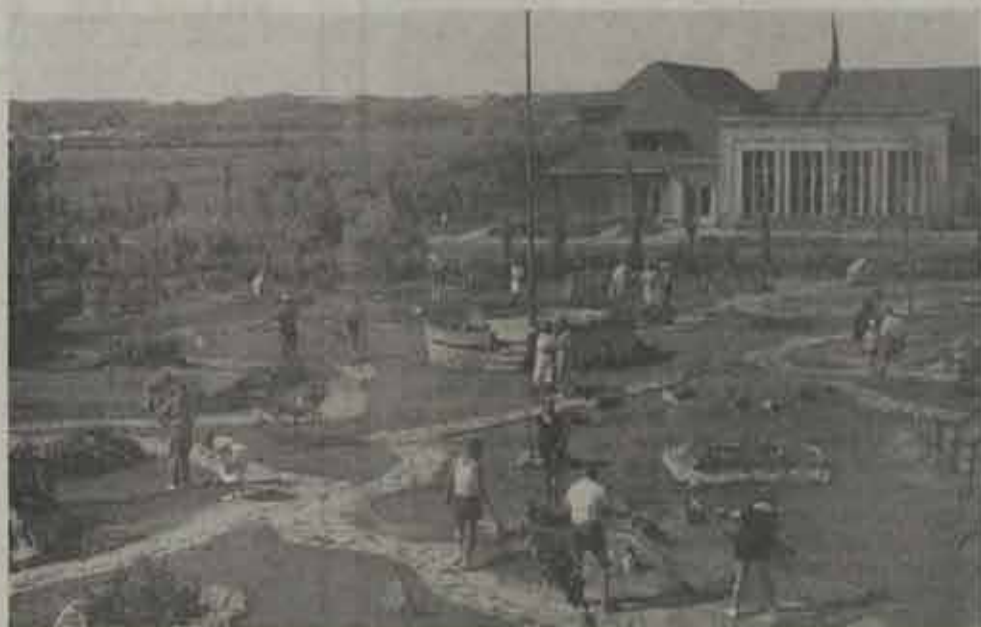
De Thomb-Thumb Golf betekent enkele uurtjes pret.