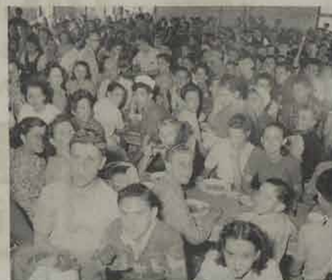
Dicht bijeen smaakte het nog zo lekker