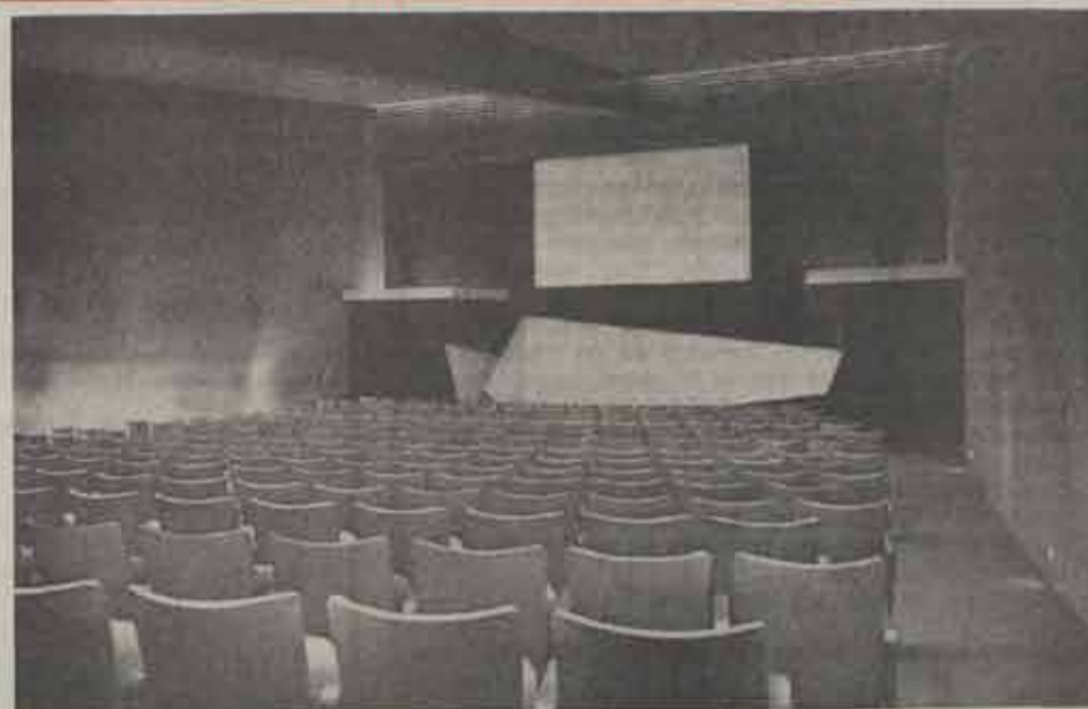
De nieuwe zaal waar iedere avond films vertoond worden.