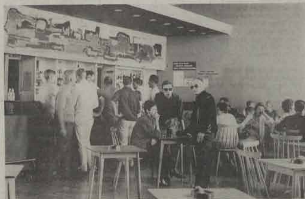
Een stemmige bar.