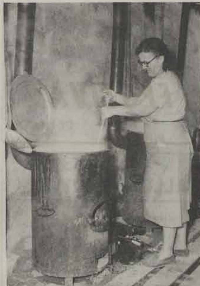
En maar roeren in de ketel want honderde hongerige magen wachten!

Met dit modern principe er nu bij kan gerust op een capaciteit van een 4.000-tal toeristen gerekend worden.