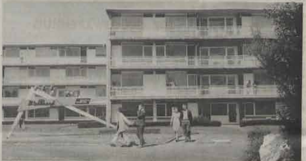
De laatste appartementenblok van „De Blekkaard”. Modern, comfortabel, elegant.