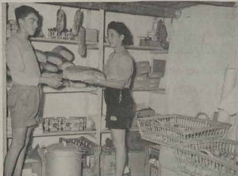
Het vroegere shopping-centrum in het Torenhol. Alles beperkte zich tot een klein provisie-winkeltje.

met te weiden stro, en de kantine leiding tot diep in de nacht opbleef om het eten voor de volgende dag tijdig klaar te krijgen. Die goede oude tijd... Ja ze zal nog lang verder leven in de annalen van het sprookjesachtige Torenhol!