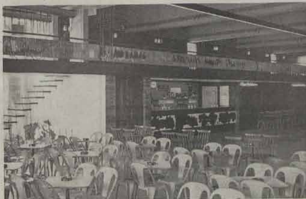
Een modern opgevatte feestzaal.