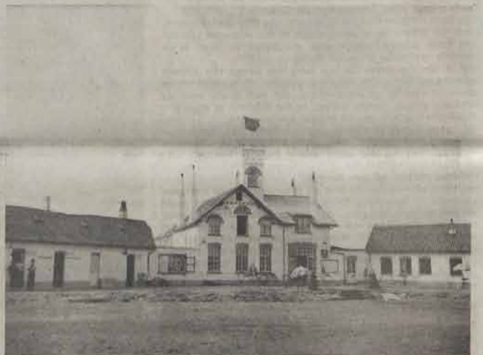
De hoeve „Torenhof“, waaruit het vakantiecentrum groeide