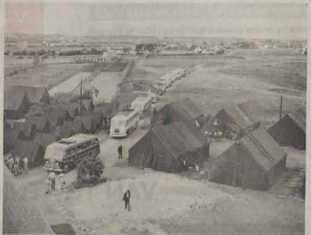
Uit dit eerste tentenkamp groeide werkelijk het idee op die Klemkerkse Heide het grootste Europese vakantiecentrum op te richten.

Zu sijn het de indertienste nu even inkwartier over „Het Torenhof“ van de „Goeie oude tijd“ waar in allerminst een wijkje geboomt werd op het terrein in heren geslagen werd op stroomke