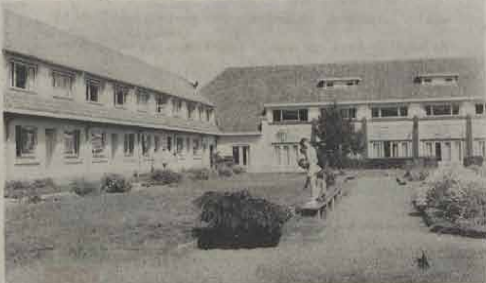
De appartementen van „Het Torenhof”.