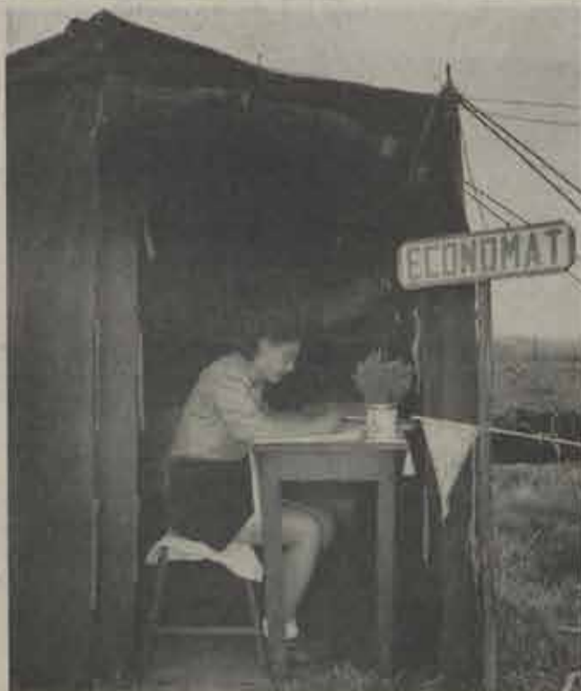
Het eerste ekonomaat.