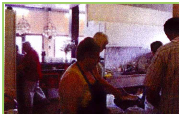
En daar is hij: de paashaas... // Lapin de Pâques ■ Pannenkoekenbak // Fête des crêpes