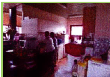
De afwas doen/faire la vaisselle