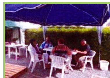
Gezellig eten/praten // manger/bavarder ensemble ■ Genieten van de buitenlucht/Profiter du plein air