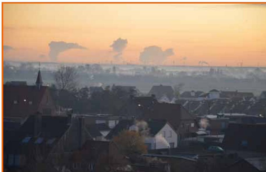
Aan de einder Zeebrugge. / Zeebruges à l'horizon.