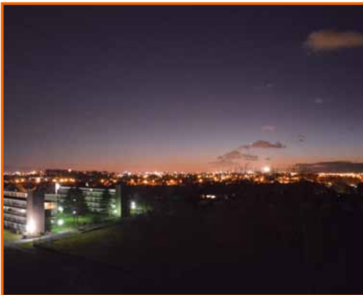
Uitzicht richting Oostende. / Vue vers Ostende.