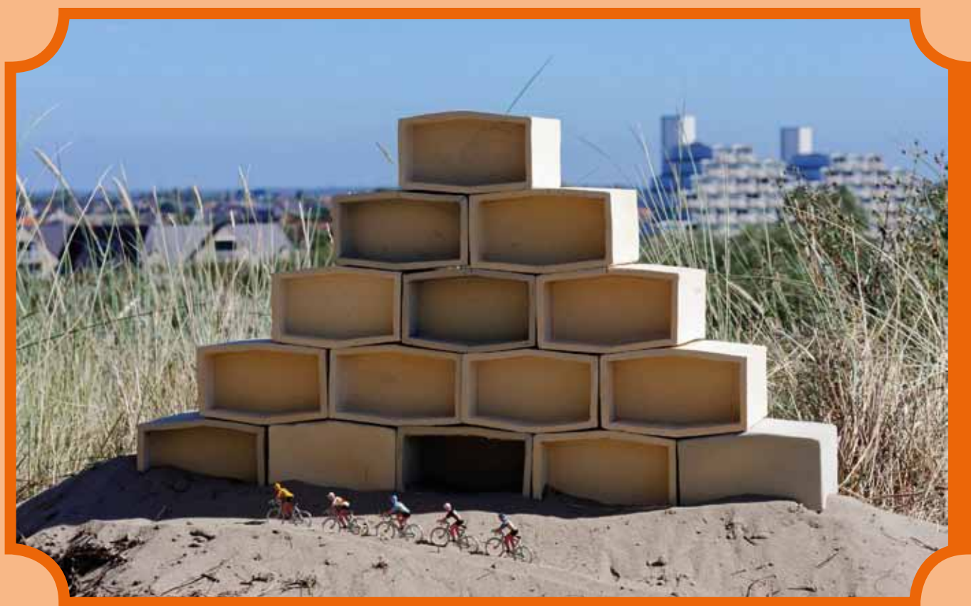
Mini-Park Atlantis / Mini-Park Atlantis (pag. 10-11)