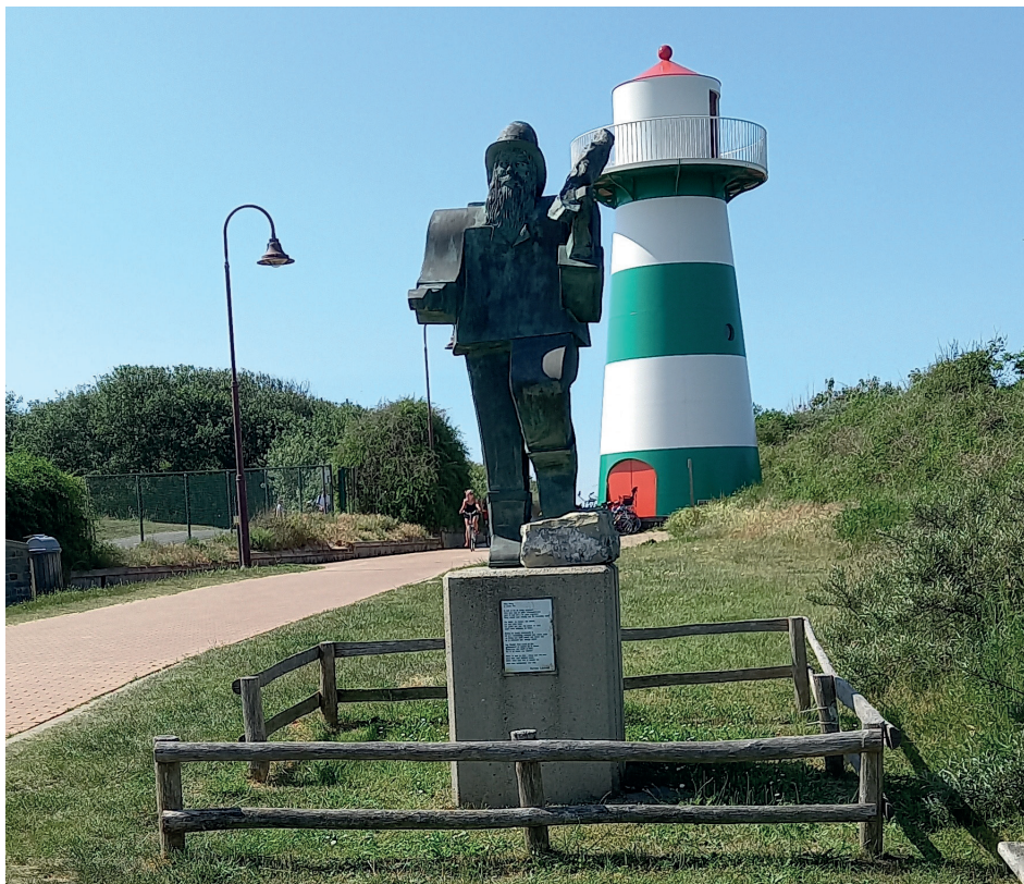
Mong De Vos op de weg naar het strand naast de voetgangersbrug

We wensen je veel vakantieplezier in en om Park Atlantis!