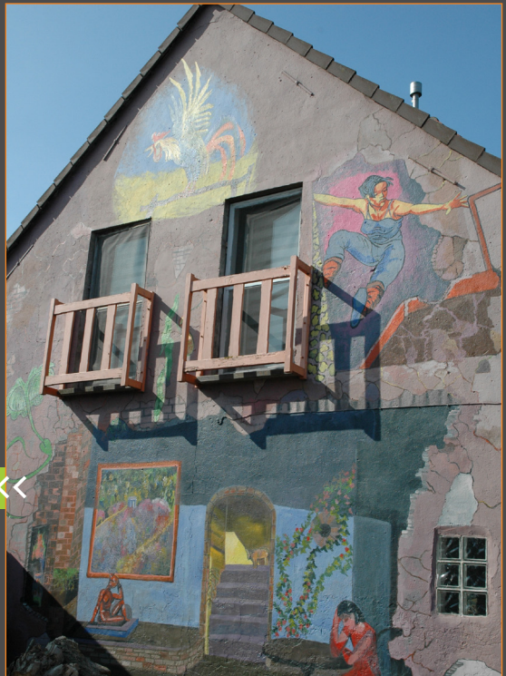
[24] Sluizenstraat 142

Deze Bredenaar houdt van vrouwen. Hier werd gekozen voor deftige zeemeerminnen op het strand